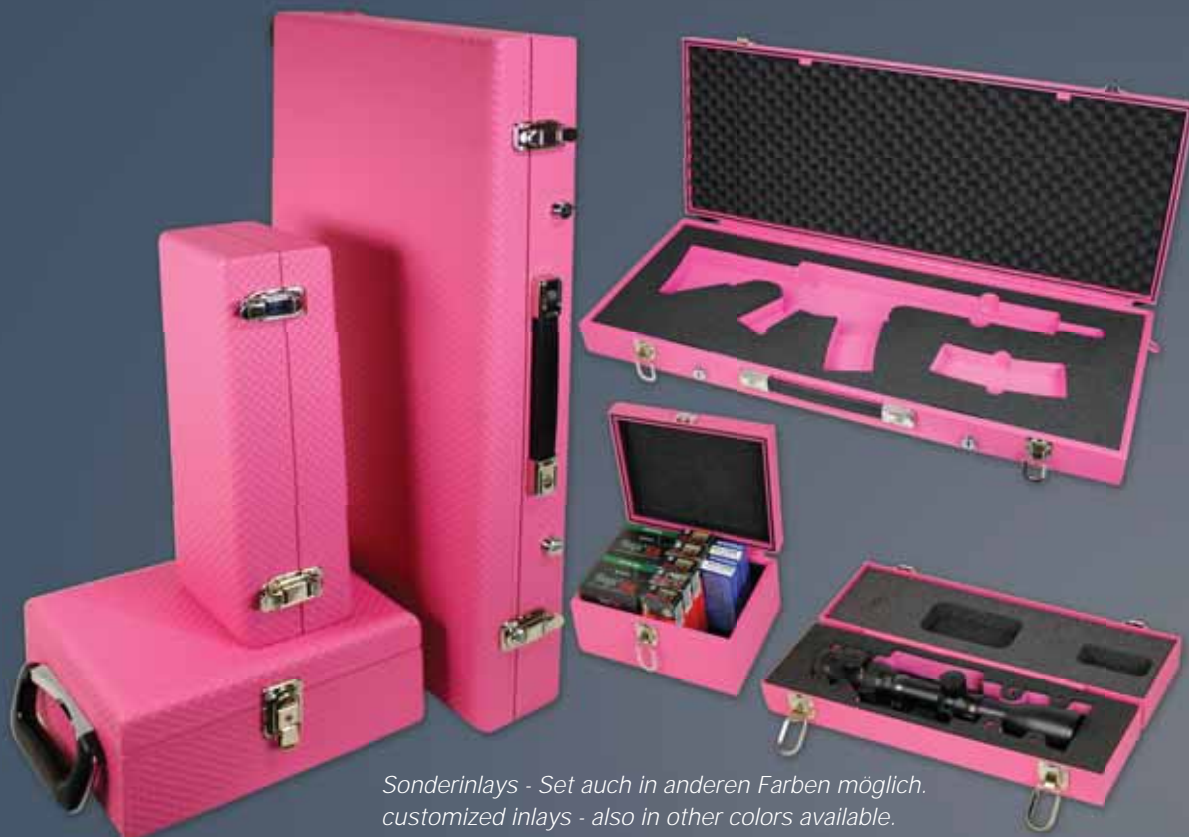
Sonderinlays - Set auch in anderen Farben möglich. customized inlays - also in other colors available.