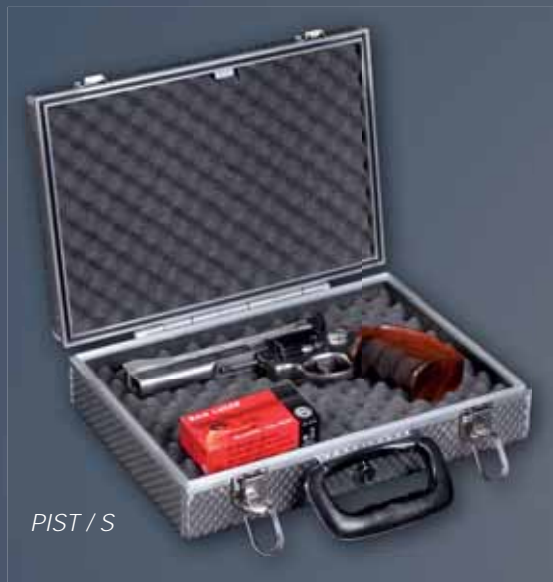
PIST / S