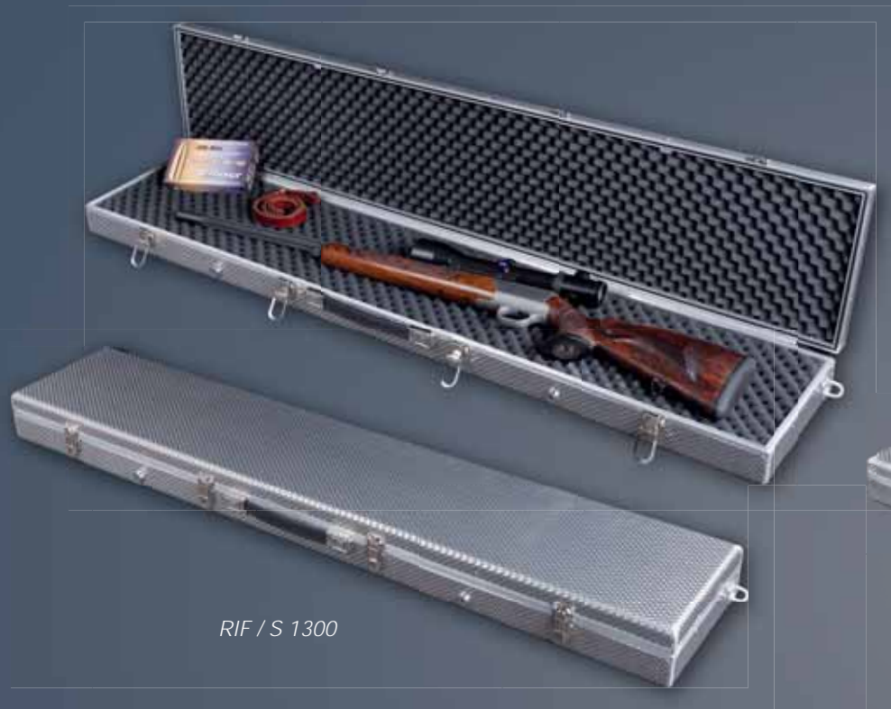
RIF / S 1300