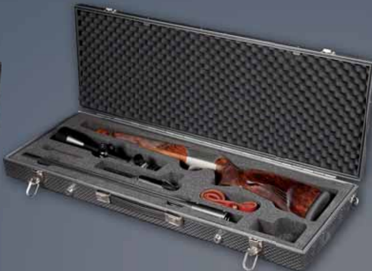
CLAYSHOT R93/R8 silver-vain