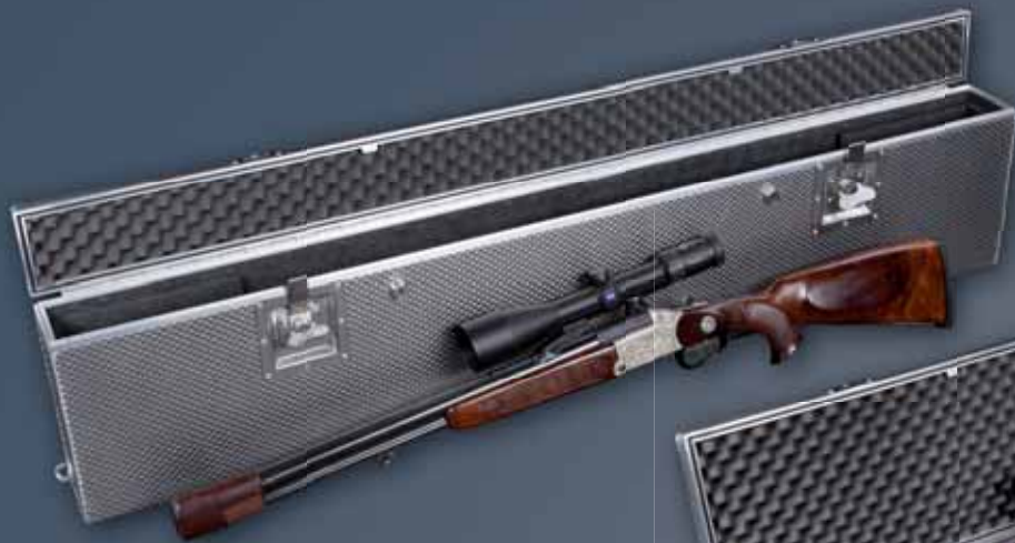
EXGUN 1 1300