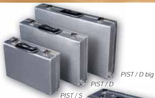
PIST / S

Can be used for two to four pistols and a large accessory compartment for, e.g. ear protection, tripod, cleaning utensils, ammunition or without accessories for four to seven pistols. Both case lids can be locked separately „for security purposes“