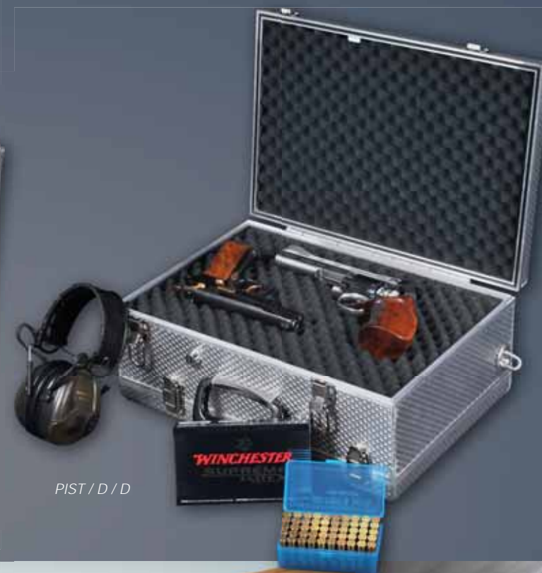
PIST / D / D