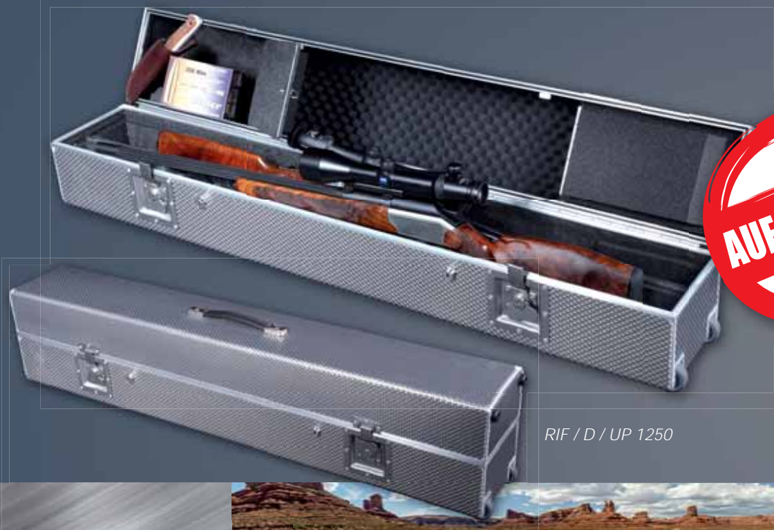
RIF / D / UP 1250