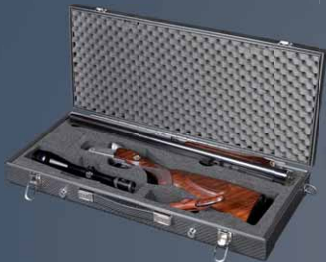
SHOT / S - UNI silver-vain