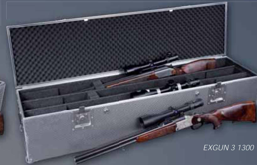
EXGUN 3 1300