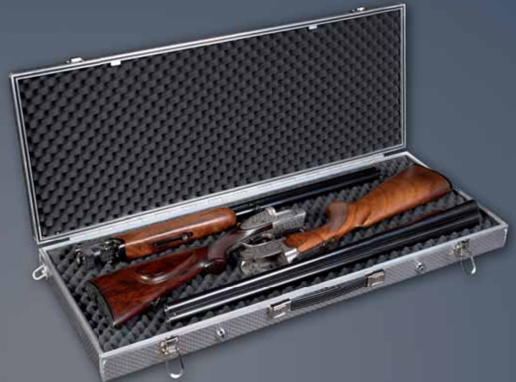
SHOT / D