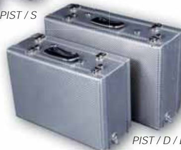
PIST / D / D