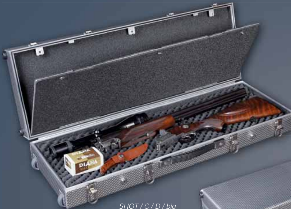
SHOT / C / D / big