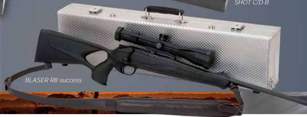
BLASER R8 success