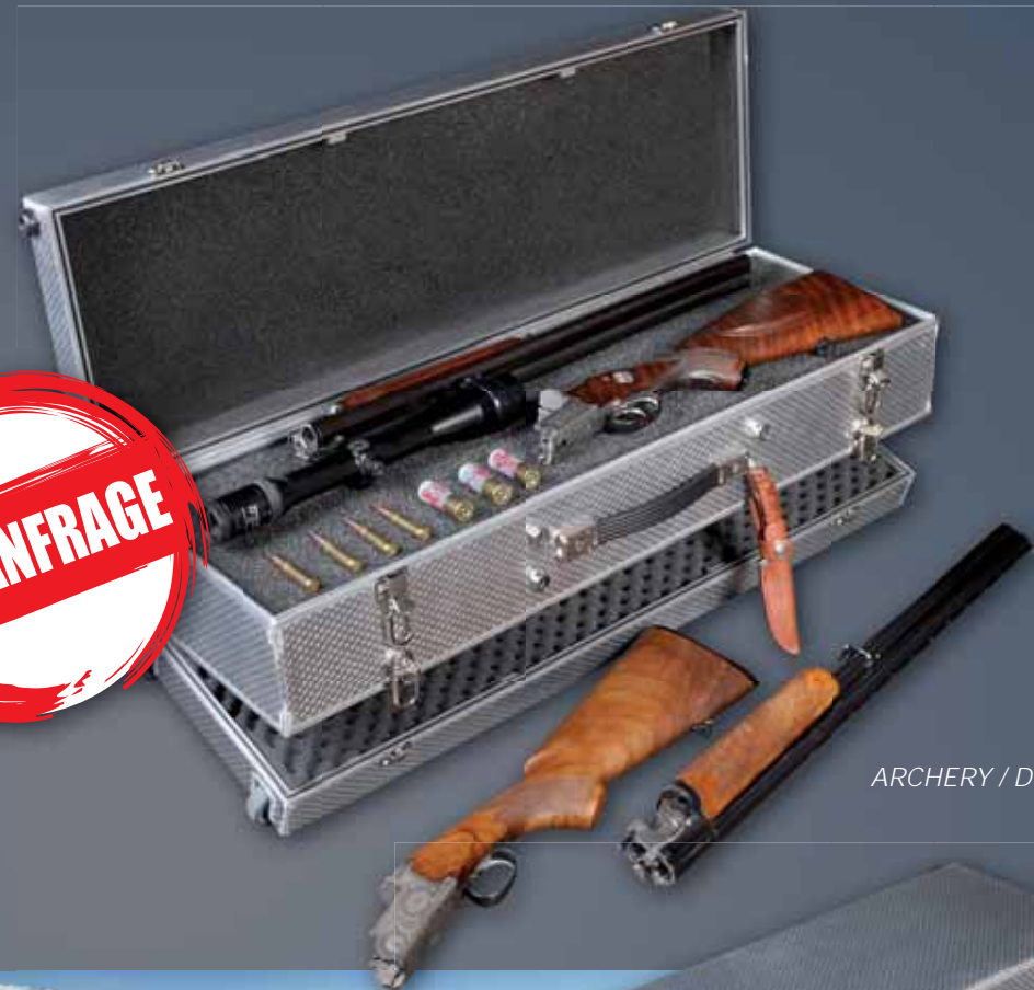
ARCHERY / D