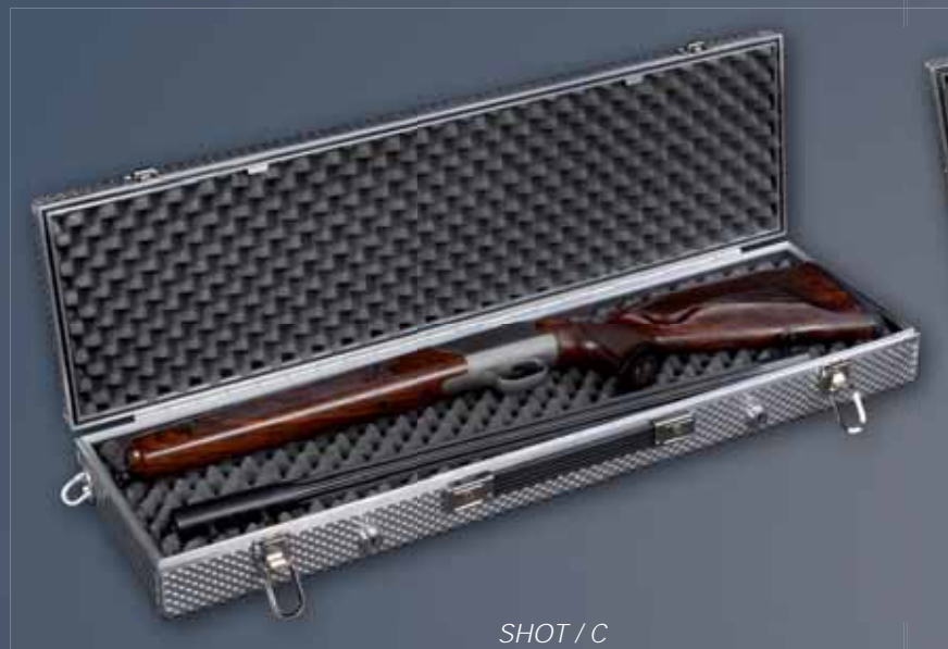
SHOT / C