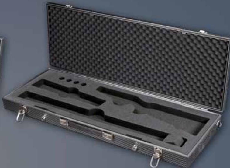
CLAYSHOT - UNI silver-vain