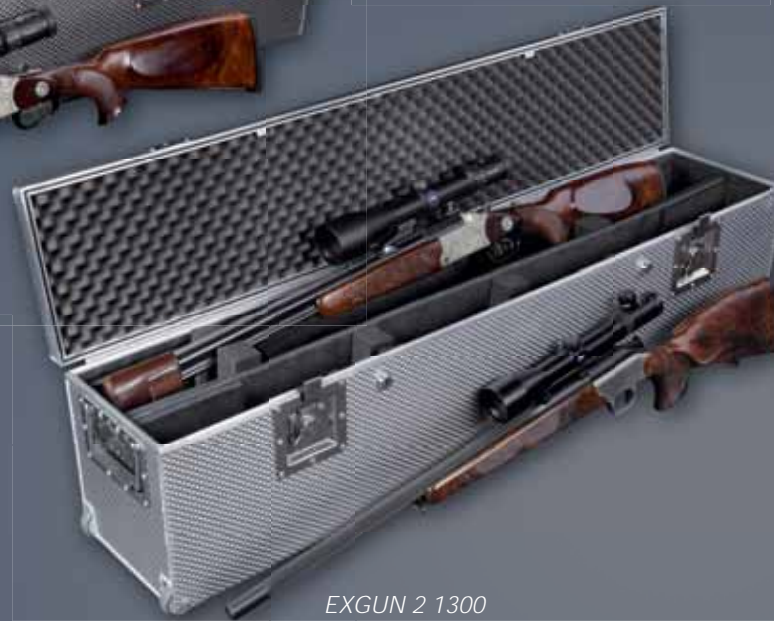
EXGUN 2 1300