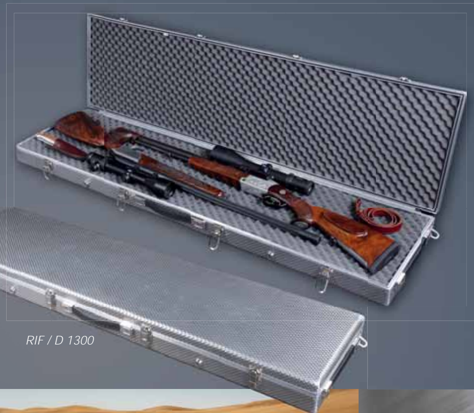
RIF / D 1300