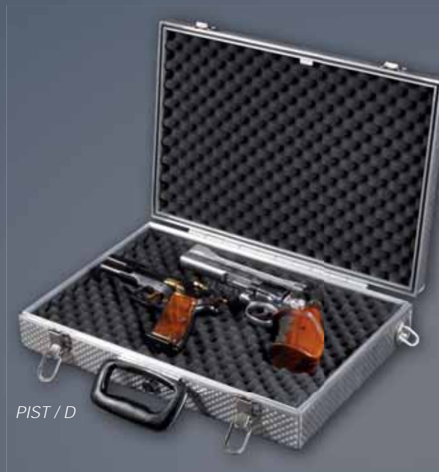
PIST / D